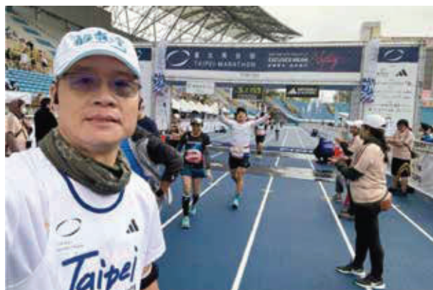
臺北田徑場內的臺北馬終點

兩年的臺北馬都不巧遇上寒流，終於在2023年底如願跑進臺北田徑場，享受眾人的熱情歡呼！這次收斂很多，直到最後出了水門後才開始邊跑邊拍，也算是圓了一個夢！臺北