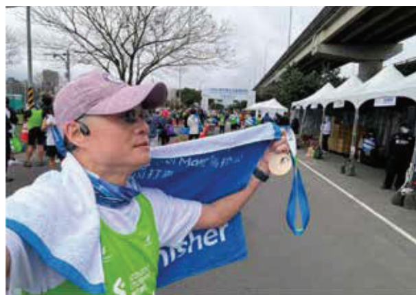
渣打臺北公益馬拉松

境？跑步前一週，利用春節假期加上年假後，安排消化道內視鏡檢查，檢查後被囑咐休息一週，跑量驟減，這告訴我要認真按表操課的重要性。渣打臺北公益馬拉松主要訴求是「為公益而跑」，讓每一步都充滿正向能量。在賽道上，我看到了許多視障跑者，他們雖然看不見，卻用堅定的步伐，跑出了生命的精彩。