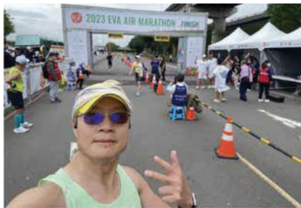
長榮城市馬拉松留影

時，因此未能完賽。後來我總算完成了人生第一次全馬，是獻給長榮城市馬拉松！那份激動與喜悅，至今難忘。清晨的臺北，空氣中還帶著些許涼意，我隨著人群湧入起跑線。賽道上，臺北的城市風光盡收眼底，每一步，都是與這座城市的美麗邂逅！