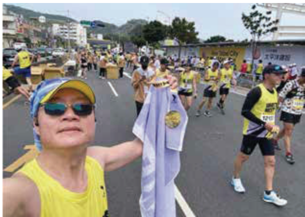
美麗的萬金石馬拉松